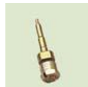
Náhradní hrot Allflex