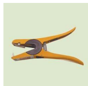
Aplikační kleště Allflex