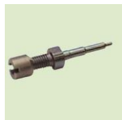
Náhradní hrot Hema