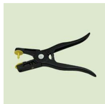
Aplikační kleště Hema